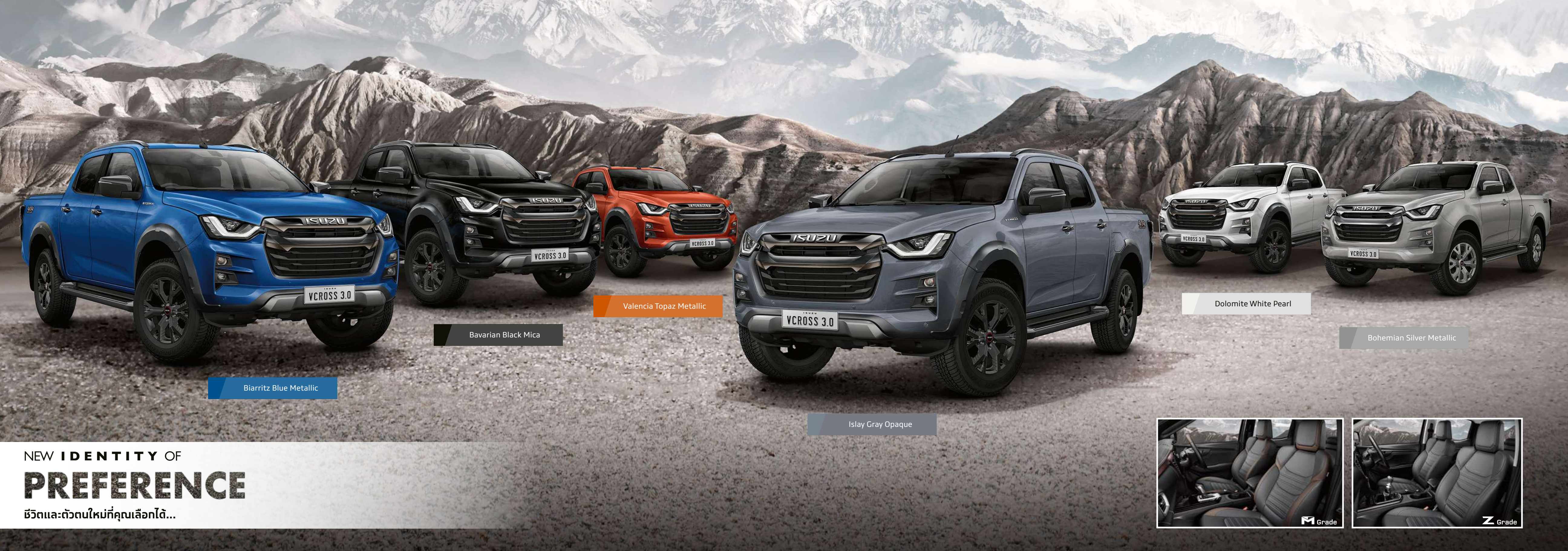
Biarritz Blue Metallic