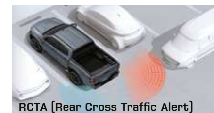
RCTA [Rear Cross Traffic Alert]