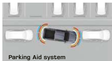
Parking Aid system